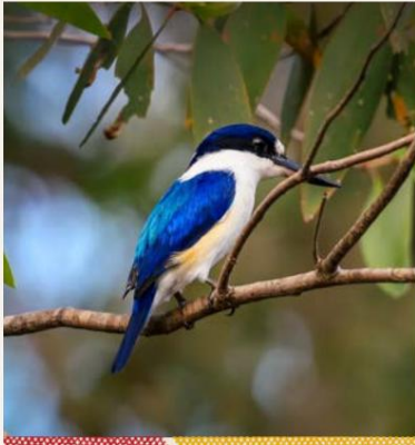
Blauwe azuurblauwe ijsvogel

Je kunt deze schuwe vogel observeren terwijl hij over het oppervlak van krekens en billabongs scheert, op jacht naar vis voordat hij in de vegetatie verdwijnt. Deze zijn zeer gewild onder vogelaars.