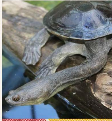
Schildpad met lange nek

Eeuwen geleden door Europese kolonisten meegebracht, hebben brumbies zich aangepast aan de barre Australische outback. Hun bevolking heeft een schadelijke invloed op de inheemse flora en fauna, terwijl ze hulpbronnen onttrekken aan inheemse dieren.